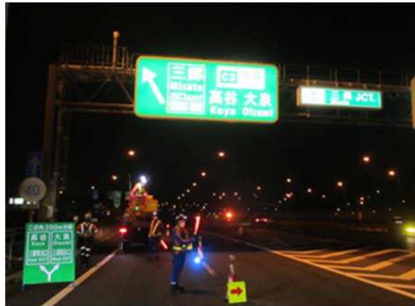
標識点検 作業状況

点検実施にあたって通常の車線規制では作業が出来ないことから、ランプを閉鎖して行う必要があります。そのため、お客さまへ極力ご迷惑をおかけしないよう、交通量が少ない平日の夜間にランプの閉鎖を行い、点検を集中的かつ効率的に実施します。安全・快適に高速道路をご利用いただくために必要な点検ですので、ご理解とご協力をお願いします。