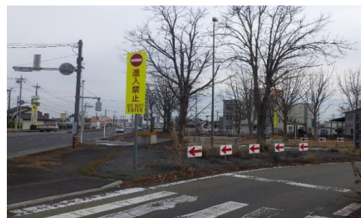
標識設置工事 作業状況