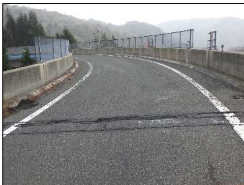
伸縮装置 損傷状況

工事実施にあたって通常の車線規制では施工が出来ないことから、ランプを閉鎖して作業を行う必要があります。そのため、お客さまへ極力ご迷惑をおかけしないよう、交通量が少ない平日の夜間にランプの閉鎖を行い、工事を集中的かつ効率的に実施します。安全・快適に高速道路をご利用いただくために必要な工事ですので、ご理解とご協力をお願いします。