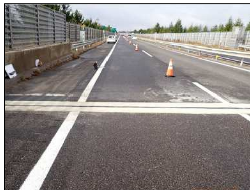
伸縮装置 取替後イメージ