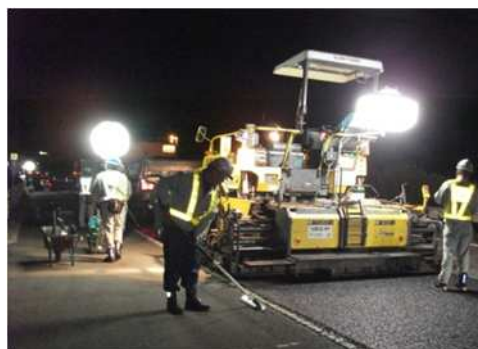
夜間舗装補修工事 作業状況