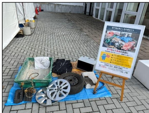
路上落下物の展示も行います