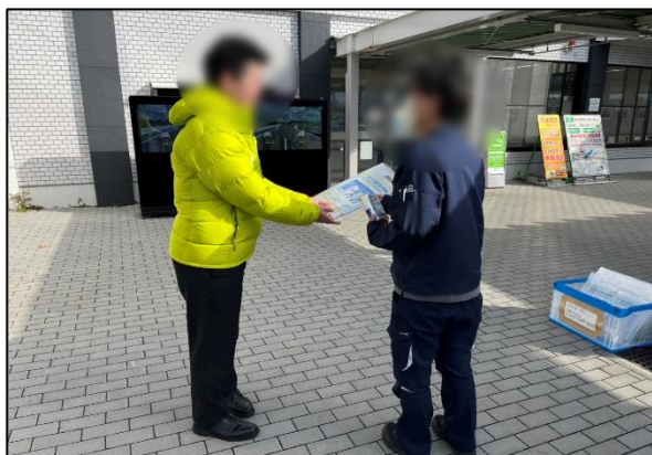
SA・PAにおけるノベルティ配布