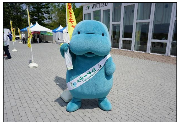
SA・PAで、マナーティと握手！