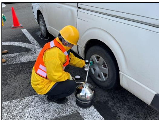
空気圧の点検 イメージ

また、タイヤ交換の時期には脱輪が発生しやすくなります。高速道路を走行中に脱輪が発生してしまうと、脱輪した車両は勿論のこと、脱輪したタイヤが他の車両に接触したり、工事規制内に勢いよく飛んでいくと、規制内の作業員にも危険が及びます。ナットの締め方に緩みが無いか確認するとともに、交換したタイヤの空気圧も補充いただき、脱輪事故防止やタイヤバースト防止に努めていただきますよう、ご協力をお願いします。