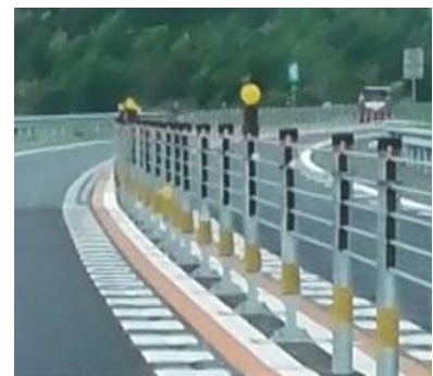
ワイヤロープ イメージ