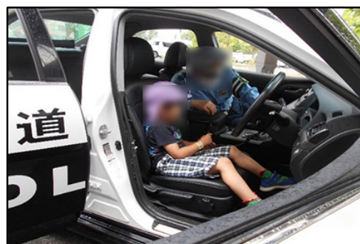
乗車体験会イメージ