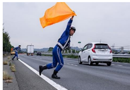
落下物を回収する交通管理隊