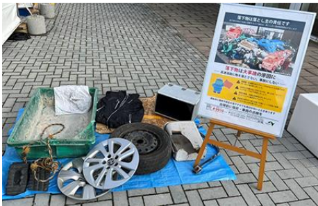
高速道路の落下物の一例

車に乗る際には、必ず積載状況を確認して落下物防止に努めるとともに、タイヤ交換時にはナットや空気圧を確認して脱輪・タイヤバーストを防止するなど、皆さんのちょっとした気遣いで、交通安全を守っていきましょう。