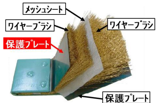
写真。テールシールの部品(ブラシ)