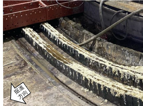
写真. テールシール(交換後)