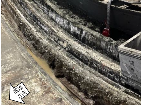
写真. テールシール(交換前)