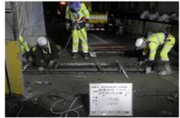
伸縮装置取替工事 作業状況