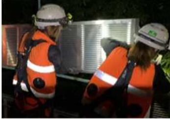
遮音壁補修工事 作業状況

安全・快適に高速道路をご利用いただくために必要な工事ですので、ご理解とご協力をお願いします。