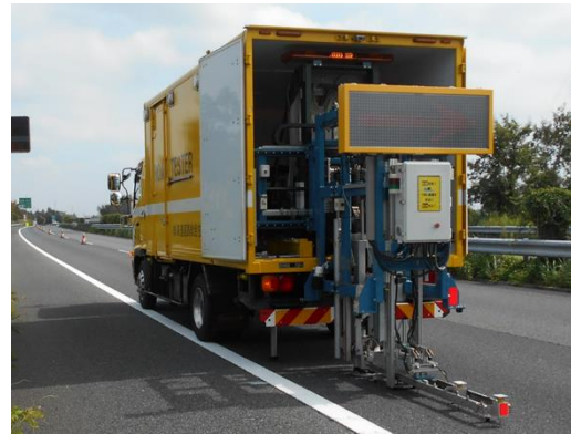
事前調査(FWD 調査) 作業状況