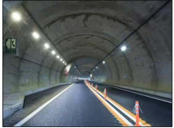
照明更新工事 作業完了後イメージ