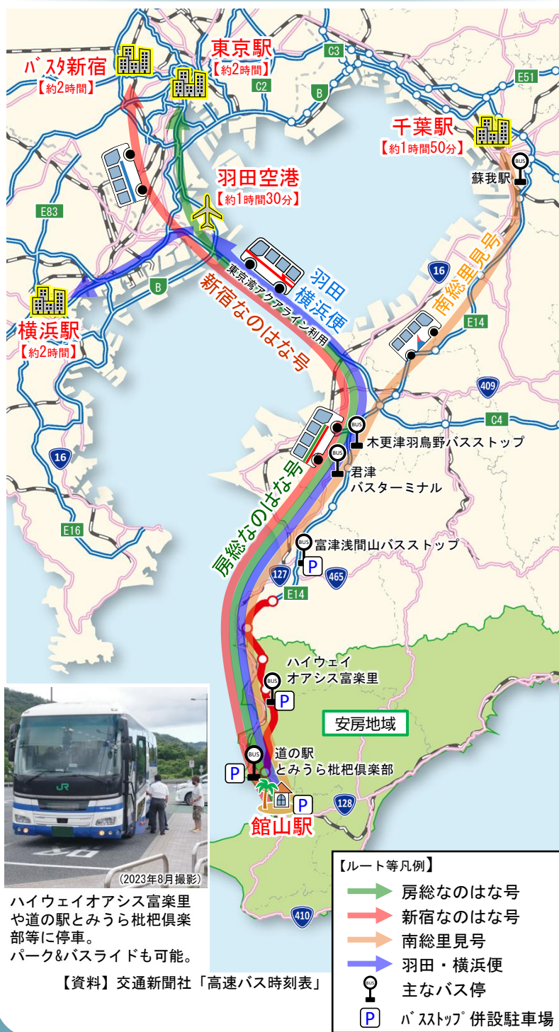
富津館山道路を走る高速バスの館山駅からの運行経路・所要時間