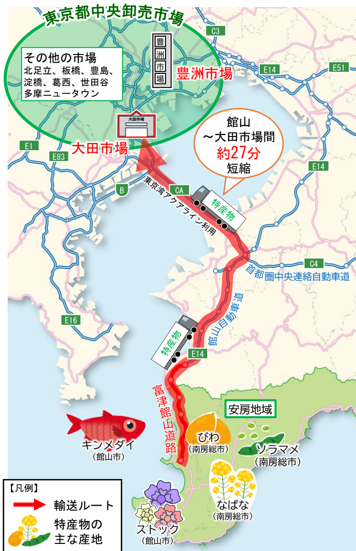
【資料】全国総合交通分析システム (NITAS) ver. 3.0