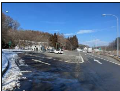
前森山 PA(下り線)状況