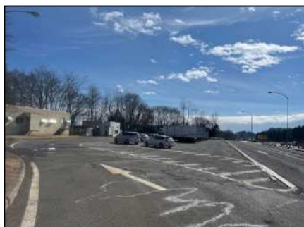
前森山 PA(上り線)状況

安全・快適に高速道路をご利用いただくために必要な工事ですので、ご理解とご協力をお願いします。