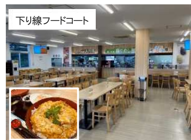
下り線フードコート