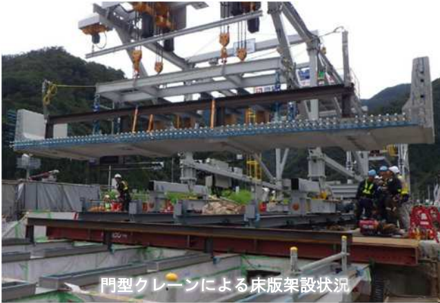
門型クレーンによる床版架設状況

高速道路のネットワーク機能を長期にわたって健全に保つため、可能な限り交通への影響を抑えつつ、老朽化した橋りょうの対策工事やトンネルの補強工事などを実施しています。令和5年度においては、道央自動車道 江別東ICの江別東IC橋など、40橋の床版取替工事、3本のトンネル補強工事を完了しました。