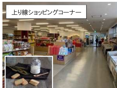
上り線ショッピングコーナー