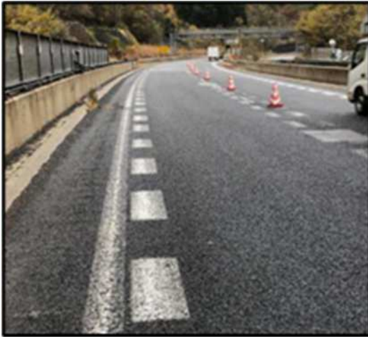
橋梁部舗装損傷写真

そのため、お客さまへ極力ご迷惑をおかけしないよう、工事を集中的かつ効率的に実施します。安全・快適に高速道路をご利用いただくために必要な工事ですので、ご理解とご協力をお願いします。