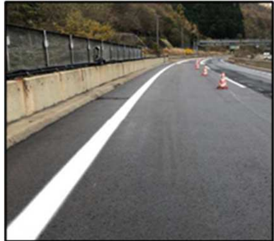
橋梁部舗装補修完了後イメージ