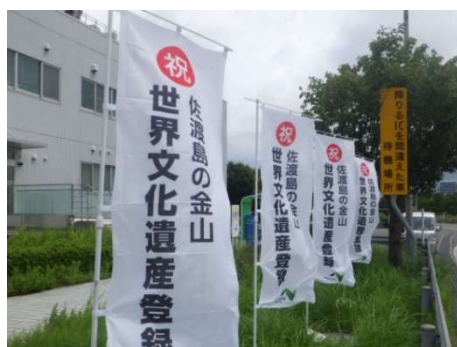
(のぼり旗:日東道 新潟亀田IC)