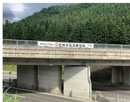
(横断幕:関越道 大崎跨道橋)