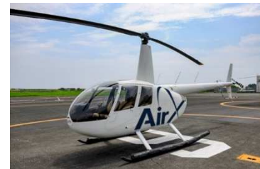
遊覧フライト機体 AirX