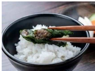
しそ巻き (宮城：東北いちば)