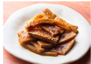
特選メンマ 極み節 (岩手：大門)

その他、“ごはんのお供”というコンセプトに合わせた各地の魅力的な商品を取り揃えています。