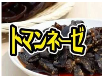
キクラゲ珍味トマンネーゼ (宮城：一路)