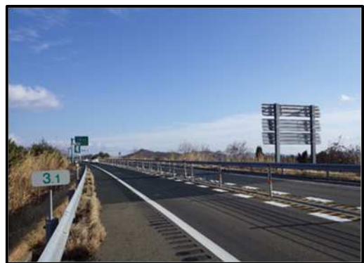
舗装補修後イメージ