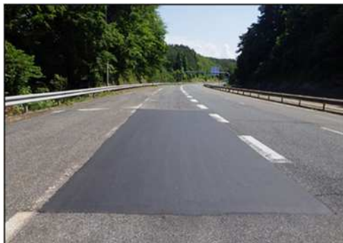
舗装補修後(イメージ)