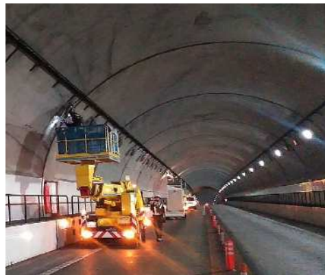
道路構造物点検作業状況