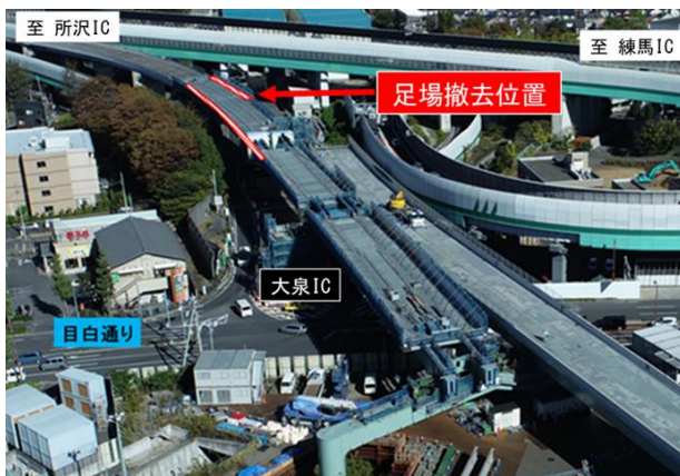
撤去する足場位置

撤去対象となります足場は大泉IC入口直上に設置されているため、安全に配慮し、大泉IC入口を閉鎖して実施します。お客さまへ極力ご迷惑をおかけしないよう、交通量が少ない平日の夜間に工事を集中的かつ効率的に実施します。ご理解とご協力をお願いします。