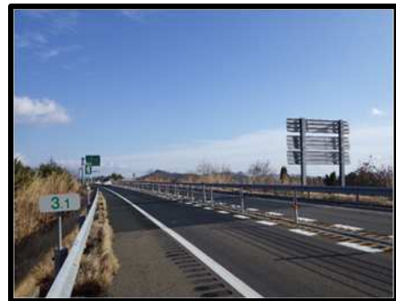
舗装補修後イメージ