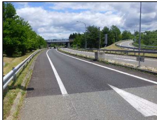
舗装補修完了後イメージ