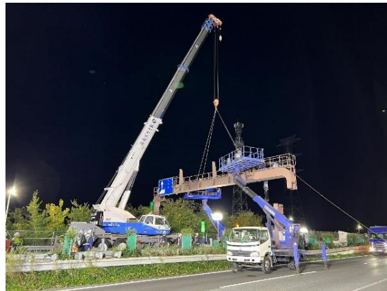
作業状況イメージ