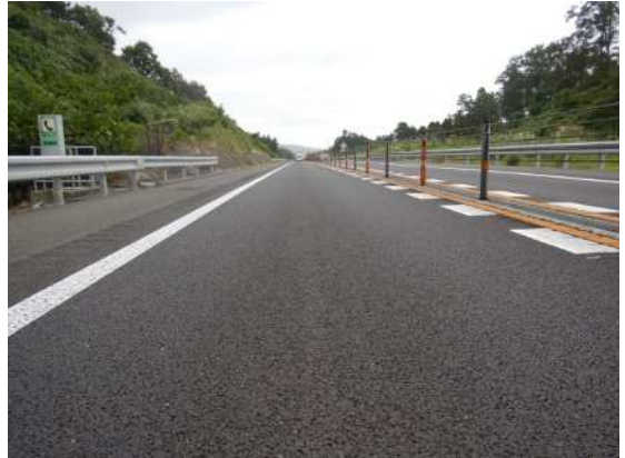
舗装補修後イメージ