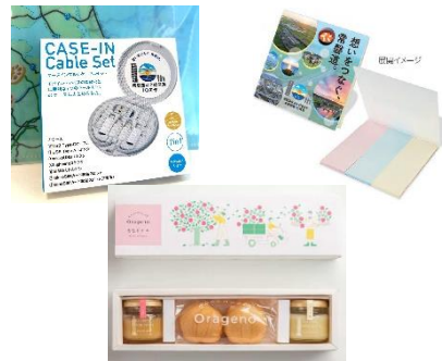
特産品・ノベルティのイメージ