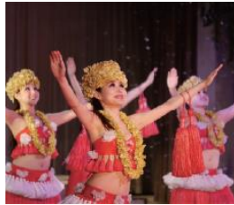
スパリゾートハワイアンズ