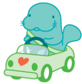
NEXCO東日本 マナーアップキャラクター 『マナーティ』