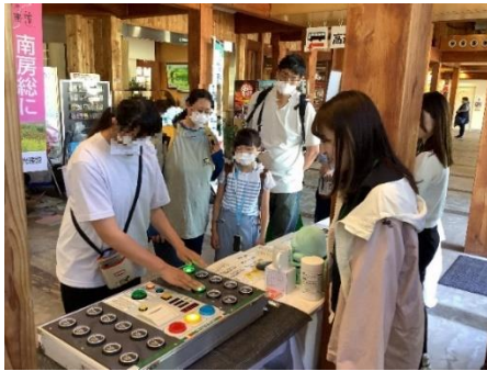
『反射神経ゲーム』の様子

NEXCO東日本ブースにて実施予定の反射神経ゲームでは、測定結果に応じて常磐道沿線の特産品や、オリジナルノベルティをプレゼントします！