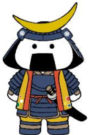
仙台・宮城観光 PR キャラクター 『むすび丸』