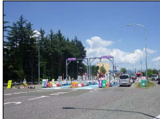
料金所屋根とりこわし後(イメージ)