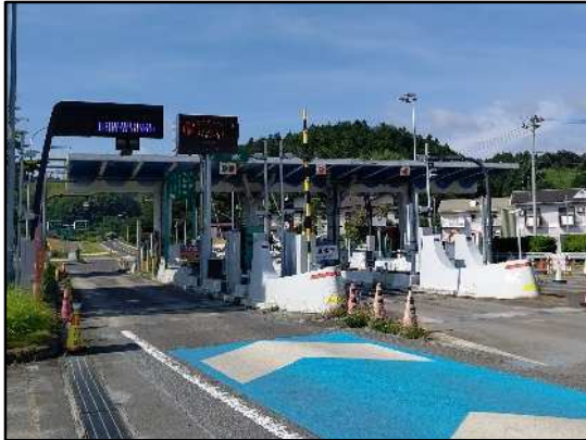
料金所屋根とりこわし前

そのため、お客さまへ極力ご迷惑をおかけしないよう、交通量が少ない平日の夜間にランプの閉鎖を行い、工事を集中的かつ効率的に実施します。安全・快適に高速道路をご利用いただくために必要な工事ですので、ご理解とご協力をお願いします。