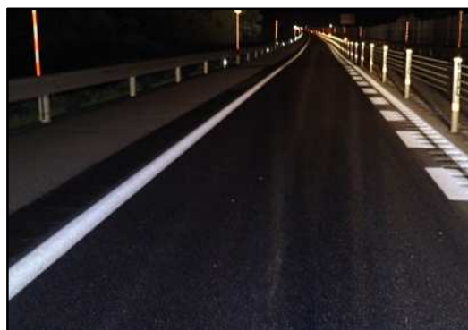
舗装補修後イメージ