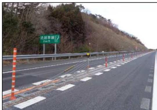
車線区分柵設置工 施工後写真(イメージ)