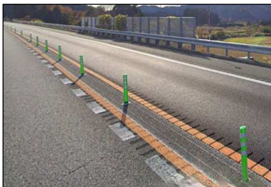
車線区分柵設置工 施工前写真

常磐道 上下線 浪江IC～南相馬ICにおいて、車線区分柵設置工事等を実施します。お客さまへ極力ご迷惑をおかけしないよう、交通量が少ない平日の夜間に通行止めを行い、工事を集中的かつ効率的に実施します。安全・快適に高速道路をご利用いただくために必要な工事ですので、ご理解とご協力をお願いします。