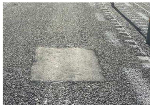
舗装補修後イメージ