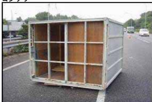
落下物の例 コンテナ