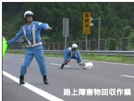
路上障害物回収作業