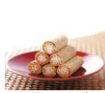
紅葉屋本店 五家寶 (埼玉県)