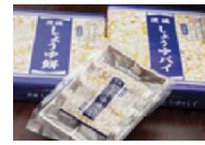
茨城しょうゆパイ (茨城県)