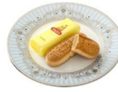
ままだおる (福島県)