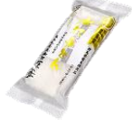
水沢うどん (群馬県)