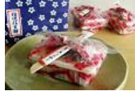
桔梗信玄餅 (山梨県)