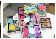
上野風月堂 ゴーフル (東京都)