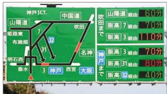
※図形情報板(神戸淡路鳴門自動車道)