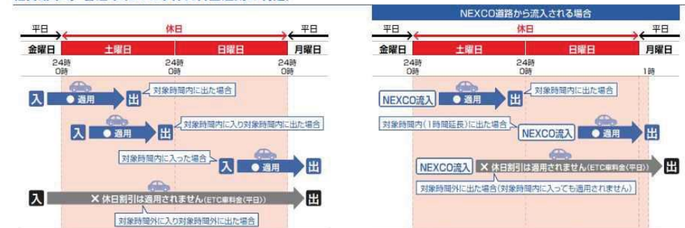
軽自動車等・普通車(ETC車休日料金適用の判定)

※割引適用時間が1時間延長されます。(延長された時間内に流入した場合を除きます。)