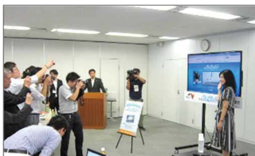
※高速道路ドライブアドバイザー(中日本)