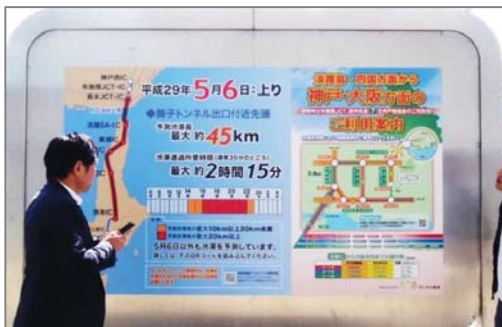
※大型ポスターによる経路選択広報(淡路SA)