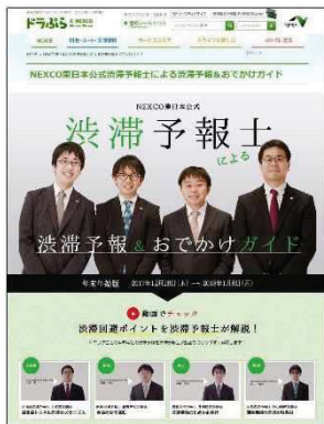
※渋滞予報士(東日本)