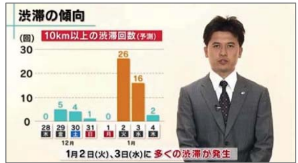
※渋滞予報士(西日本)