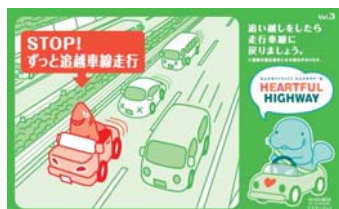
追い越し後は後方確認をおこない、 走行車線に戻りましょう！