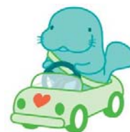
マナーアップキャラクター 「マナーティ」