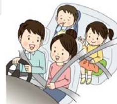
チャイルドシートも忘れずに！

高速道路等の死亡事故で後部座席同乗者の死亡者のうち約7割がシートベルト非着用。全席着用義務となっていますので、後部座席同乗者も必ずシートベルトを着用しましょう！