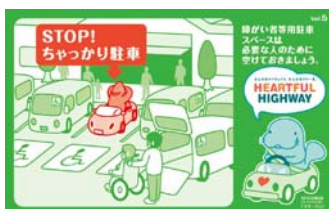
障がいをお持ちの方や妊婦さんのためのスペースです。 本当に必要な方のために空けておきましょう。