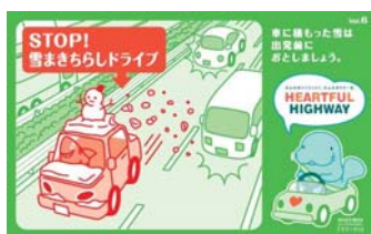
車に積もった雪は出発前に落としましょう！