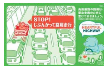
路肩は緊急車両のために 空けておきましょう！