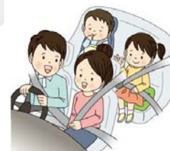
チャイルドシートも忘れずに！

高速道路等の死亡事故で後部座席同乗者の死亡者のうち約7割がシートベルト非着用。全席着用義務となっていますので、後部座席同乗者も必ずシートベルトを着用しましょう！