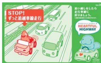
追い越し後は後方確認をおこない、 走行車線に戻りましょう！