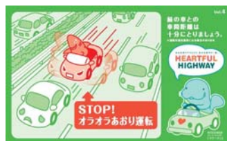
イライラ運転は思わぬ大事故に… ゆとりをもったドライブ計画を！