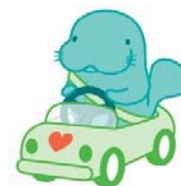
マナーアップキャラクター 「マナーティ」