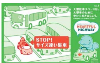
自分の車のサイズに合った 駐車マスに停めましょう！