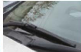
冬ワイパーチェック