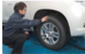
冬タイヤチェック

例年、初冬の11月頃から事故が急増します。特にトンネルの出入口や橋の上などは凍結しやすいので注意が必要です。早めの冬装備を心がけましょう。