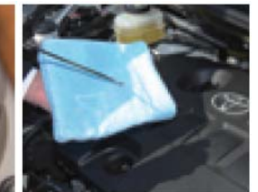
オイル量チェック