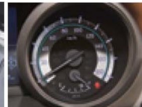
ガソリン量チェック