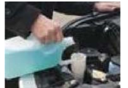
冬用ウォッシャー液チェック