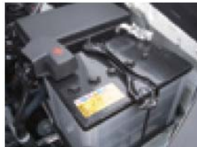
バッテリーチェック

北海道の高速道路での故障車は、年約4,500件。(H28.5～H29.4実績。NEXCO東日本調べ) 出発時の点検は忘れずに。