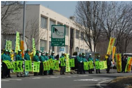
過去のキャンペーンの様子