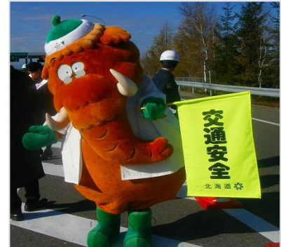
当社キャラクターも登場します マナーティ（左）、マンモシ博士（右）