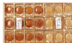
しんや北の帆立 (常呂町)