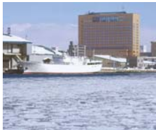
釧路プリンスホテル 一泊室料ペア宿泊券

北海道の特産品、ホテル宿泊券、施設利用券等道内各施設より商品をプレゼント (賞品一例)