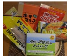
稚内ブランド詰合せ