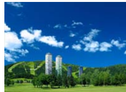
星野リゾート トمام ペア宿泊券