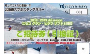
ニセコグラン・ヒラフ 2018/2019 シーズン リフト 8 時間券