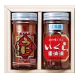
粒うに一夜漬け いくら醤油詰合せ (礼文町・稚内市)