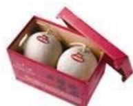
太陽の女王(メロン) (富良野市)