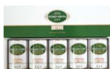
函館五島軒 カレー詰合せ (函館市)

平成30年5月から1年間(年4回)北海道各地の特産品(各5,000円相当)をお届けします。