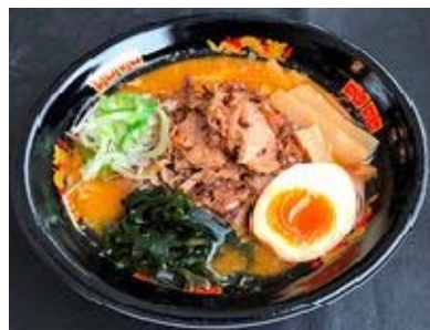
肉盛り味噌らーめん