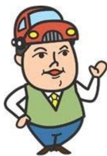
北海道 渋滞予報士