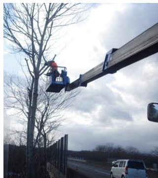
【高所作業車での伐採作業】