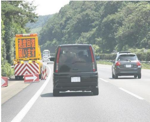
①上り坂等での速度低下注意喚起