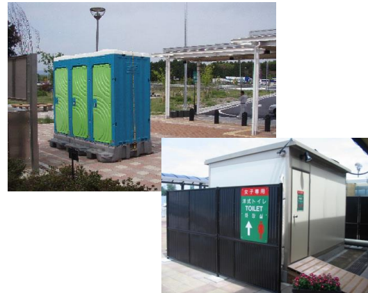
④臨時トイレの設置