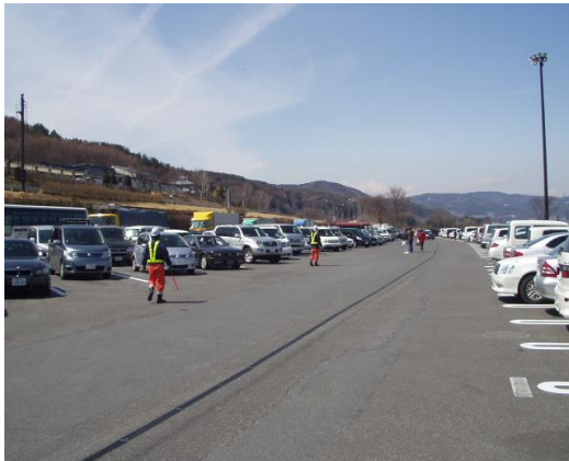
③休憩施設等での駐車場整理員の配置