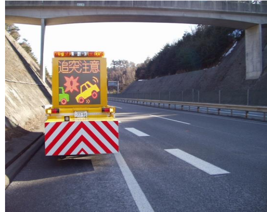
②渋滞後尾への追突注意喚起