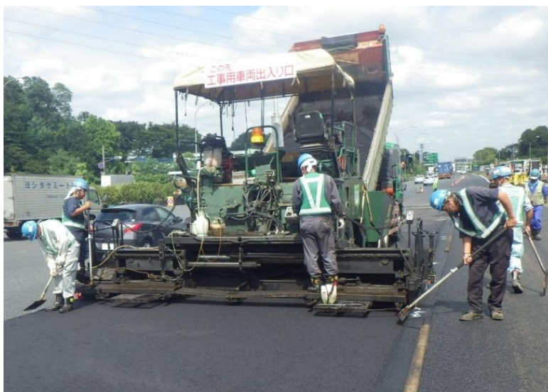
舗装補修工事（昼間）施工状況