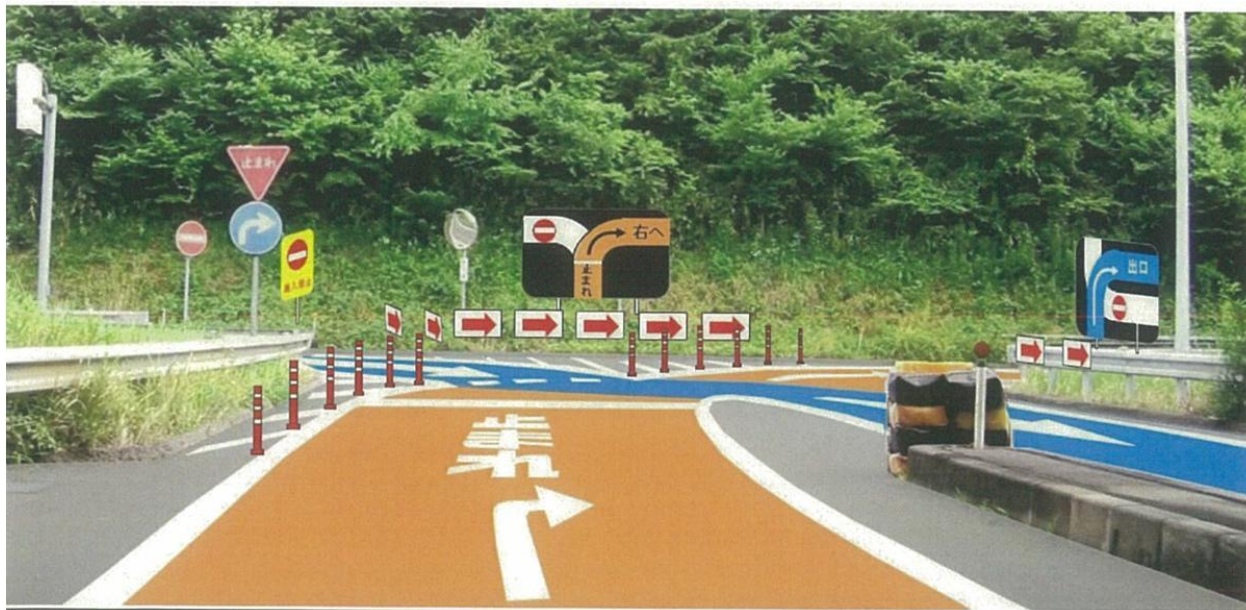
《完成イメージ:逆走防止対策工事》

お客さまに安全・快適に高速道路をご利用いただくため、ご理解とご協力をお願いします。