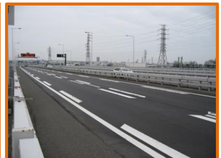
【アスファルト舗装の完了※】