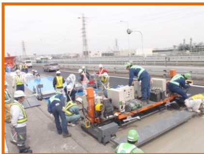
【鋼繊維補強コンクリート打設状況※】