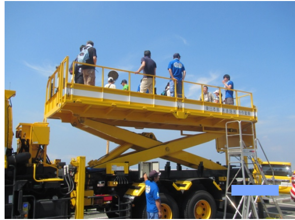
【リフト車の体験試乗(イメージ)】