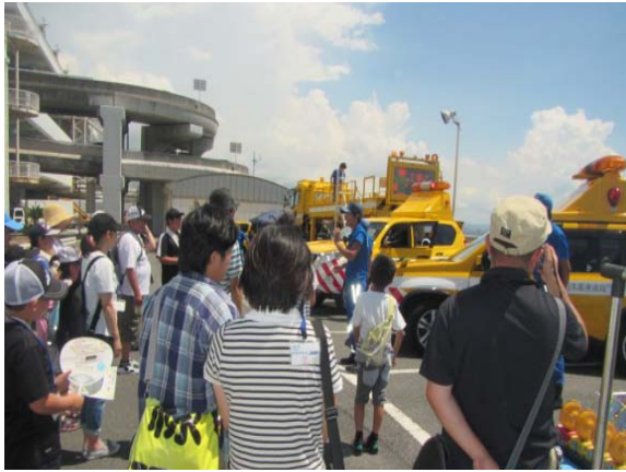
【道路パトロールカーの体験試乗】