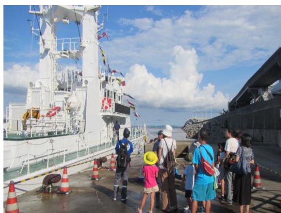
【船の見学(イメージ)】