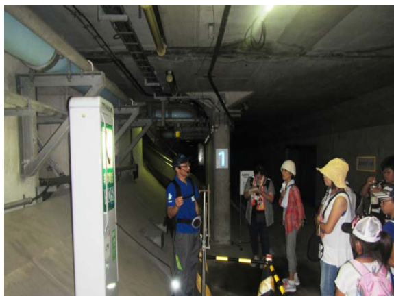
【アクアトンネル：緊急避難通路探検】