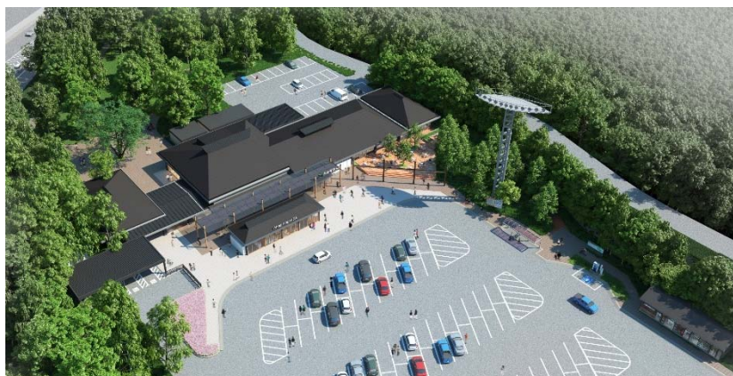
《俯瞰外観イメージ(グランドオープン 平成30年4月下旬予定)》