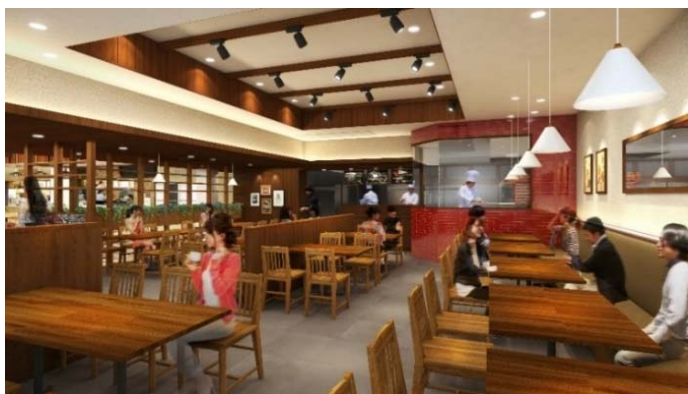
《レストラン イメージ》