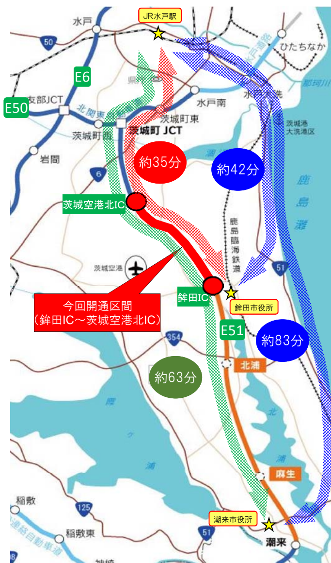
■ 銚田市からJR水戸駅までの所要時間