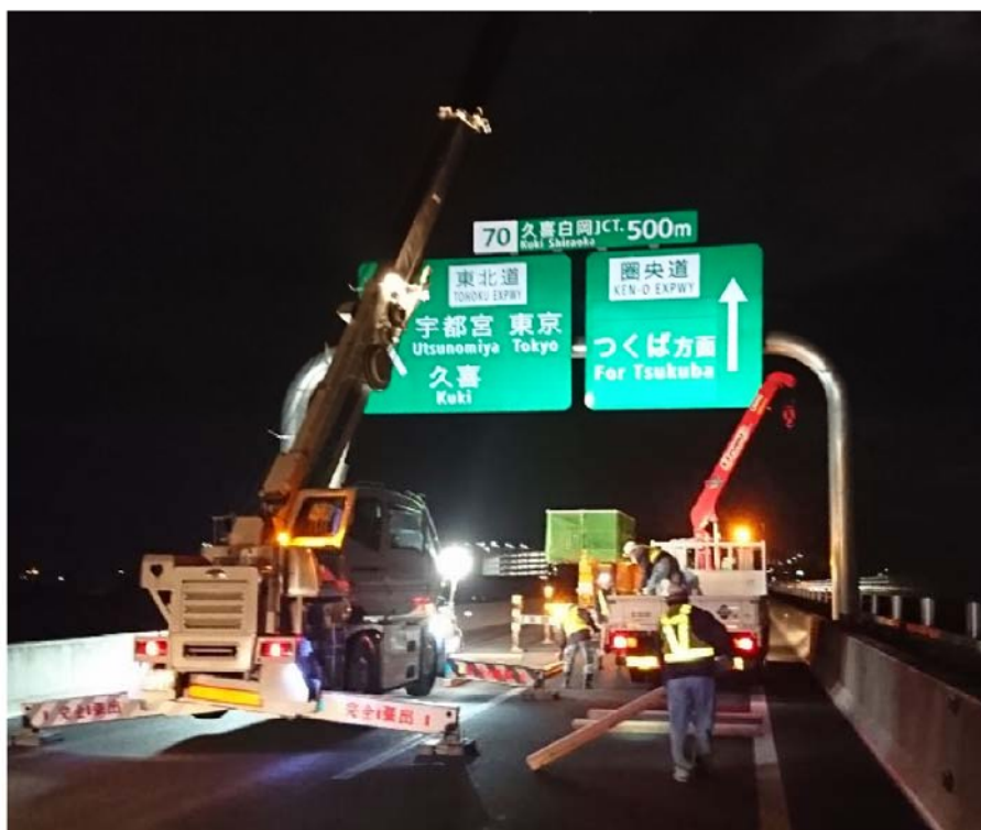
標識設置工事イメージ

外環道 三郷南ICから高谷JCTへの延伸に伴い、標識・情報板の設置工事を実施します。