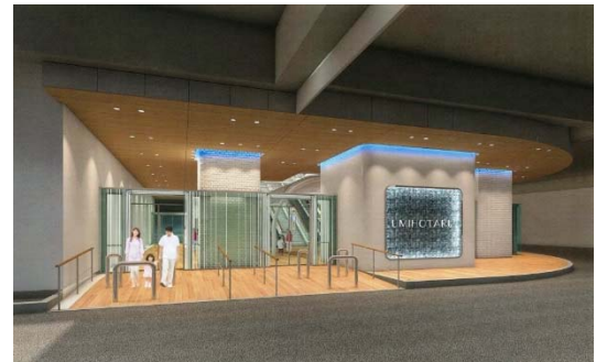
1階 エントランス(改装後)